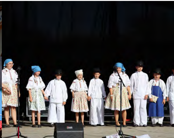
DFS a DCM Špačci a Hrozének Mutěnské vinobraní