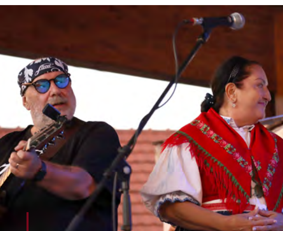
Fleret Mutěnské vinobraní