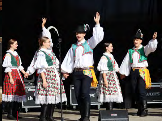
SLPT Radošov Mutěnské vinobraní