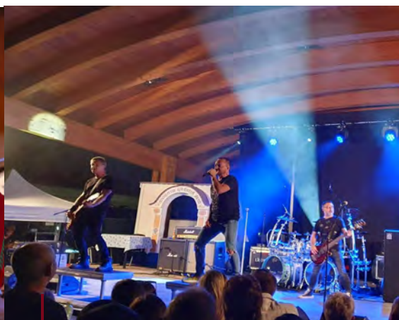
Argema Mutěnské vinobraní