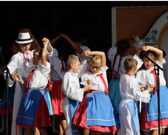
DFS Súček a Mašlička Mutěnské vinobraní