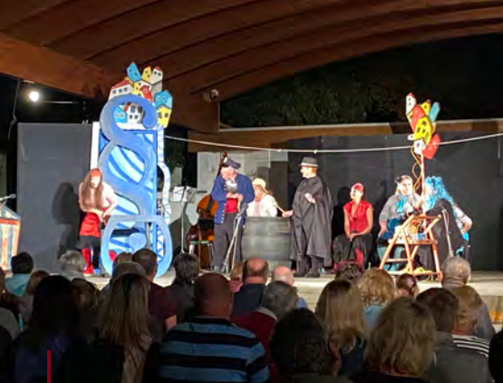
Ořechovské divadlo Mutěnské vinobraní