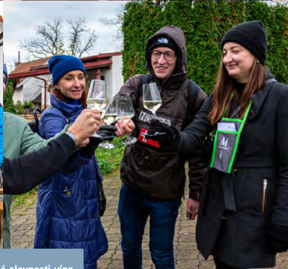
Svatokateřinské slavnosti vína