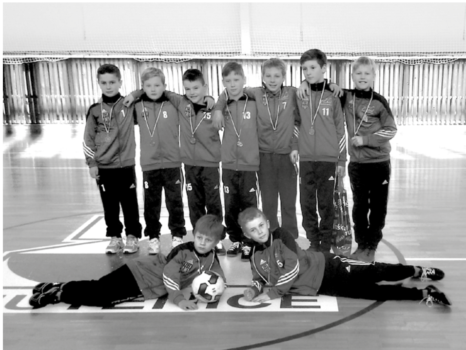
Turnaj halové ligy starší přípravky v Mutěnicích třetí místo