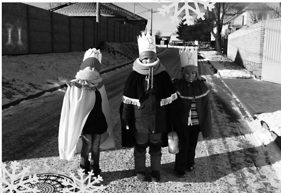
Pracovnice CHPS Mutěnice