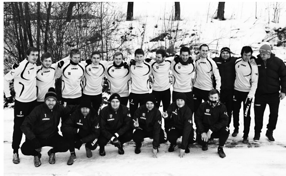
Na soustředění A-mužstva panovala dobrá nálada!

Jarní cesta našich borců za vítězstvím v krajském přeboru začne na hřišti Sparty Brno v sobotu 18. března v 15.00 . Na našem stadionu Pod Búdama se poprvé představíme až o dva týdny později, kdy