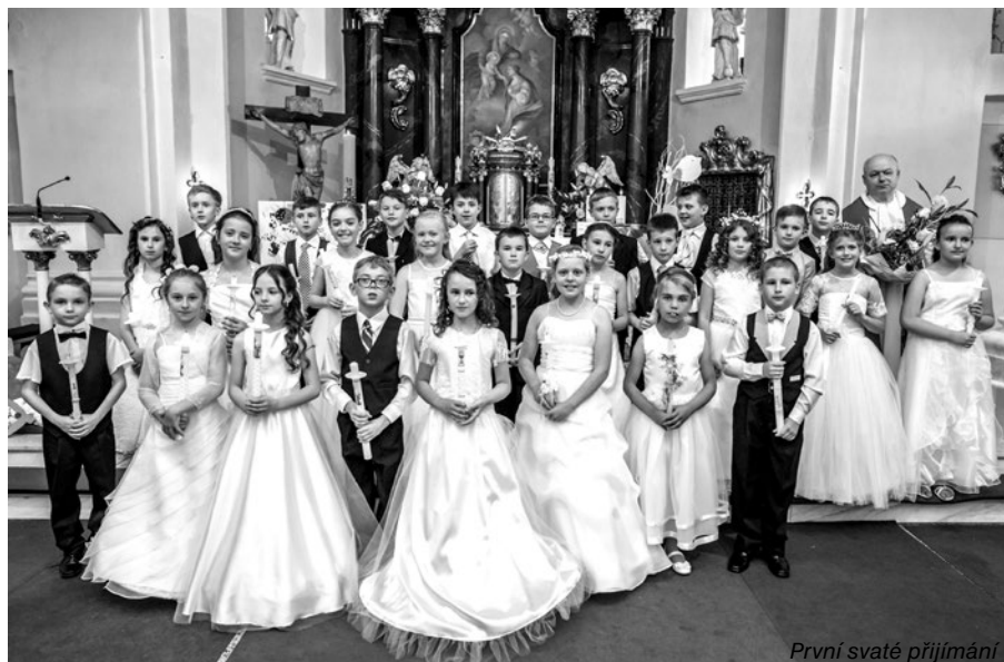
První svaté přijímání