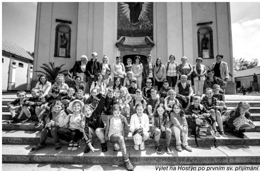
Výlet na Hostýň po prvním sv. přijímání