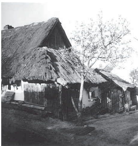
Horňáčkův dům - pod Búdama. Jedna z posledních doškovic v Mutěnicích. Fotografie - rod. Ištvánková č. 500

U nás v Mutěnicích platilo dolnorakouské „Horenské právo“ – tak zvané „Falkenštejnské“. Pocházelo z rakouského městečka u moravských hranic..