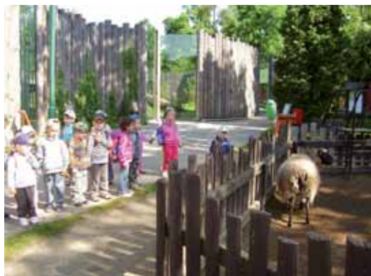
Návštěva ZOO v Hodoníně