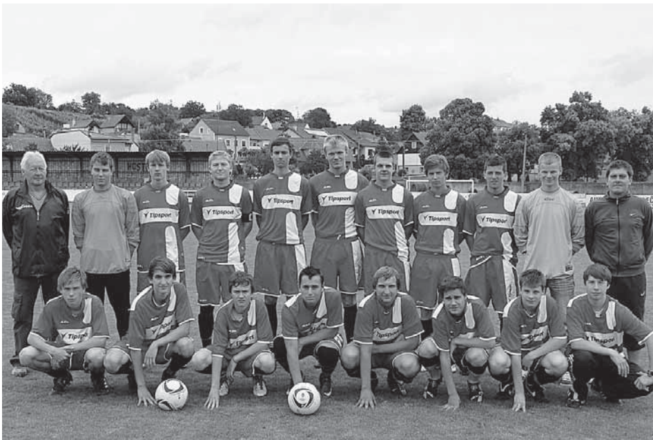
Starší dorost FK Mutěnice: