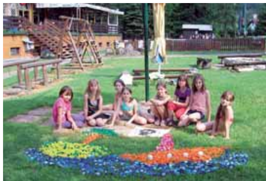
Škola v přírodě

Zpravodaj Rady obce NAŠE MUTĚNICE. Povoleno OÚ Hodonin pod č.j. MK ČR E 12437 Vydává Rada obce Mutěnice.