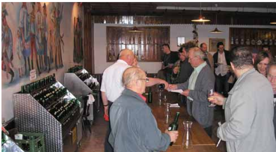
Výstava vín 2011