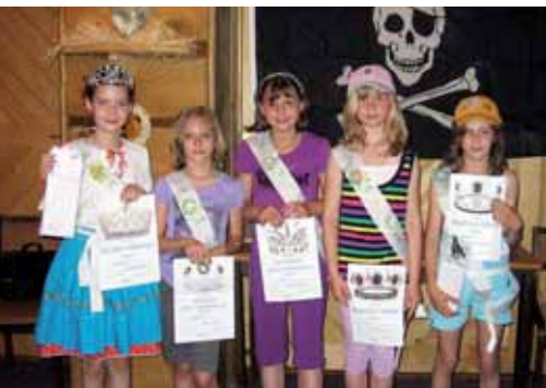
Škola v přírodě - volba miss