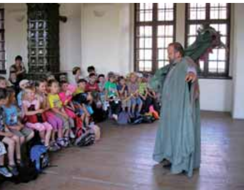
Návštěva zámku v Bučovicích