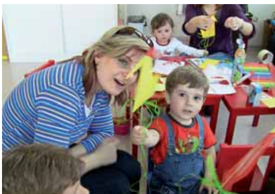
Centrum Žofka Pohádkový les