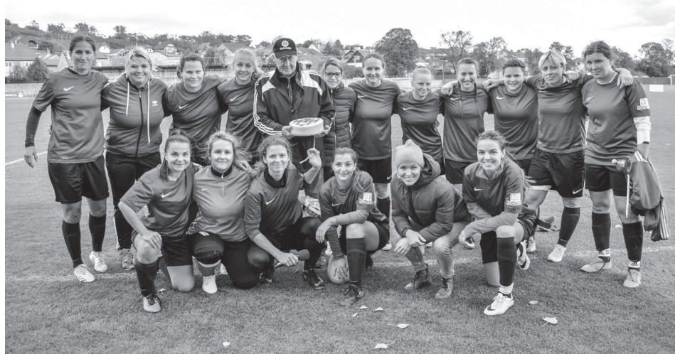
FK Mutěnice - Ženy