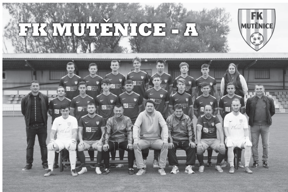
FK Mutěnice - A

Ani A-mužstvo nemá, bohužel, za sebou povedený podzim. Odchod 6 hráčů, tedy více než poloviny základní sestavy, by zamával s každým mužstvem. Přišli sice šikovní, ale vesměs mladí, nezkušení hráči,