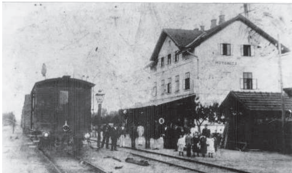
Vlakové nádraží Mutěnice r. 1900