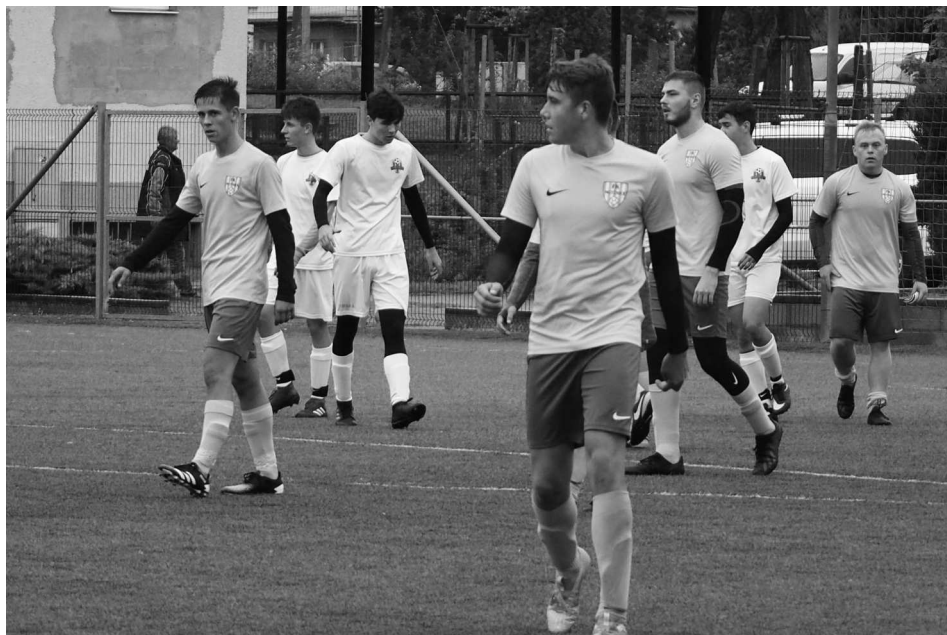
Soběšice porazil starší dorost 3-1

V roce 2021 nás měla čekat organizace 4. ročníku Galavečera mutěnského fotbalu. Bohužel současná epidemiologická situace pořádání podobných akcí zřejmě nedovolí.