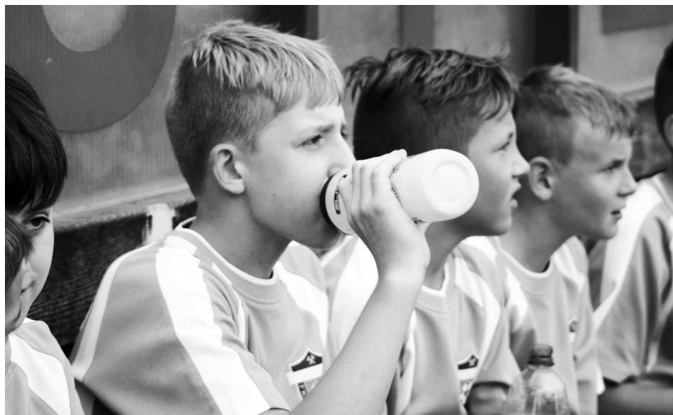
Ve Šlapanicích mladší žáci vyhráli 1-0

vozí své ratolesti k tréninkům do Dubňan a do Svatobořic. Pro zachování fotbalových soutěží bohužel aktuálně opravdu jinou možnost nemáme.