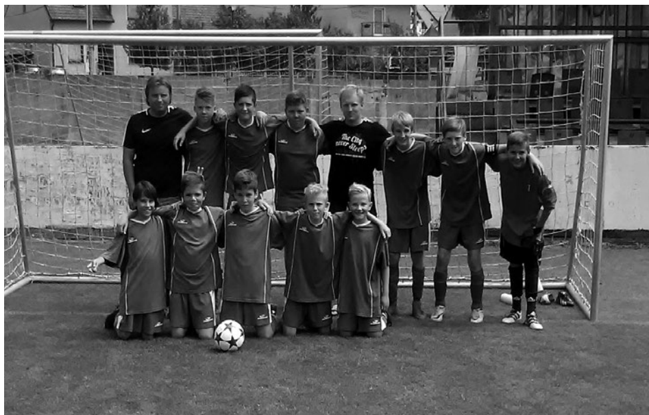
FK Mutěnice mladší žáci

A-mužstvo nenavázalo na loňské 2. místo a v celkové tabulce obsadí v lepším případě 5. a v horším 6. místo. Což určitě není ostudou vzhledem ke všem odchodům a zraně-