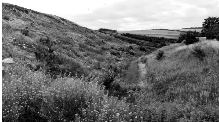
Místo rozšíření skládky mezi stávající skládkou a kompostárnou