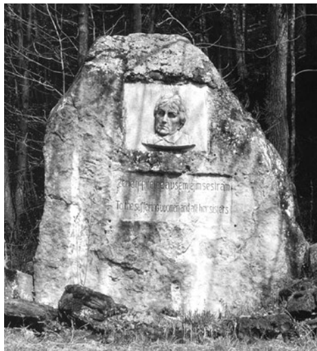
Jediný pomník Charlotty G. Masarykové v ČR postaven v roce 1926 v obci Hutisko-Solanec

Později se stalo místním zvykem, že všichni obyvatelé této oblasti připojovali ke svému jménu i název této oblasti – Garrigues, ze které pocházeli. Z takové rodiny tedy byl po svých předcích i otec Charlotty a odtud tedy původ jejich jména.