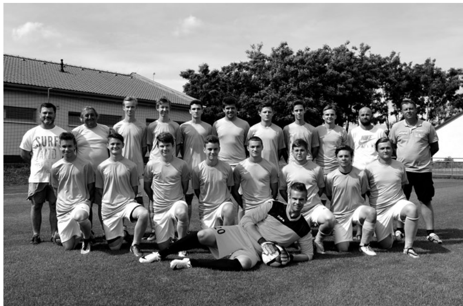
FK Mutěnice dorost, vítěz I. tř. sk. C 2017/2018