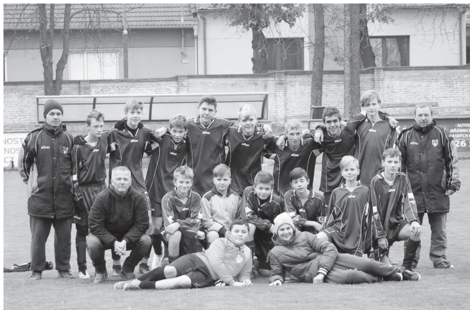
Starší žáci Mutěnice - Dubňany