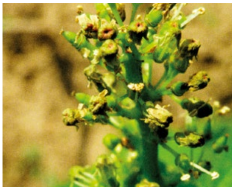
Obr. 10 Napadení květenství šedou hnilobou u odrůdy Solaris

O termínu, intenzitě a rozsahu odlistění je vhodné rozhodovat až přímo ve vinici. A ke