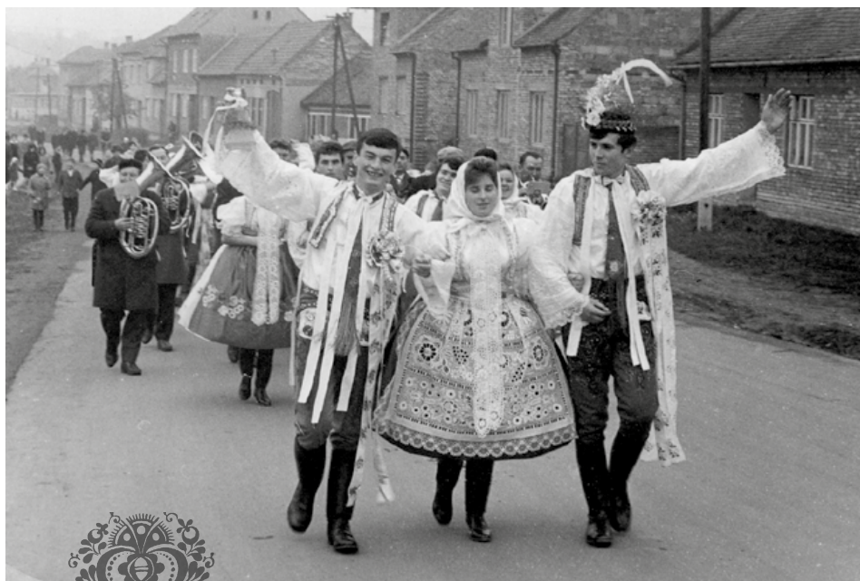
Pro zajímavost, foto chasy na hody před 50 lety.