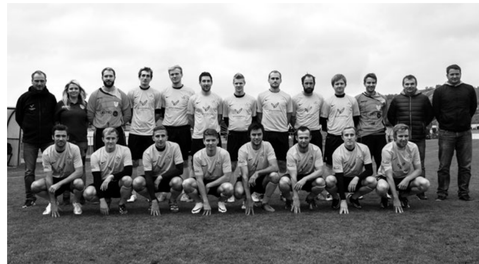
FK Mutěnice „A“ - krajský přebor 2016/17