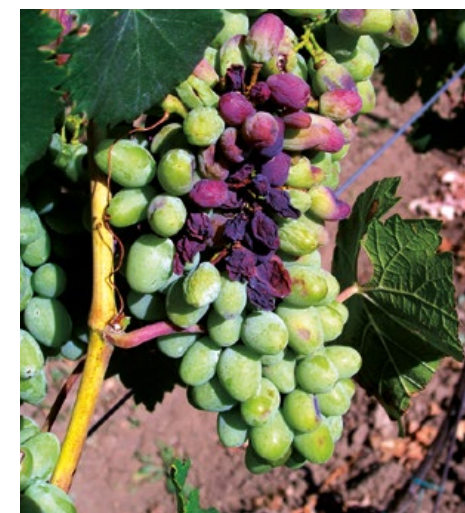
Konečná fáze slunečního úpalu

Brzké odlistění zóny hroznů značně zvyšuje jejich kvalitu a senzoričké vlastnosti vína,