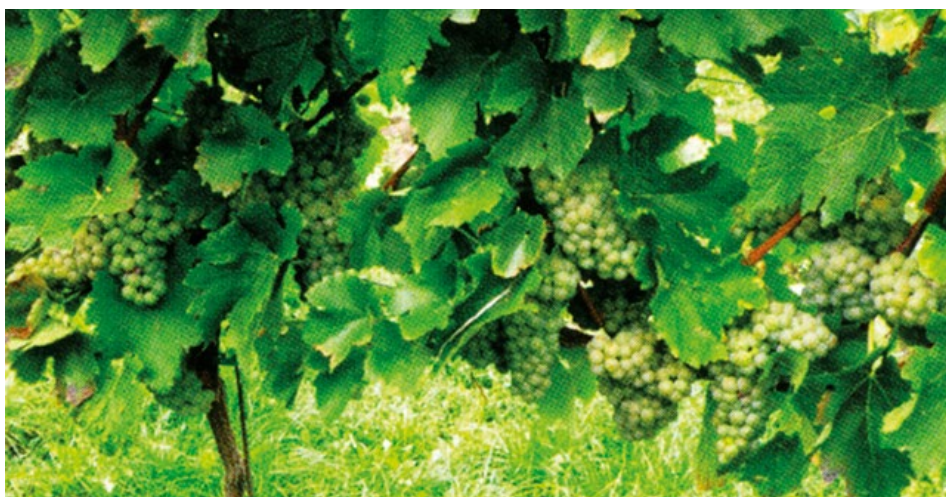
Obr. 12 Keř pouze s vylamováním zálistků v zóně hroznů

každé odrůdě přistupovat individuálně. Je totiž hodně faktorů, které mohou odlistění ovlivnit a ty je třeba zohlednit. Odlistění závisí na směru řad a jejich vystavení slunečnímu záření, stanovišti, průběžnému počasí, pěstitelském tvaru, odrůdě, povětrnostním podmínkám a také typu daného vína, které má být vyrobeno.