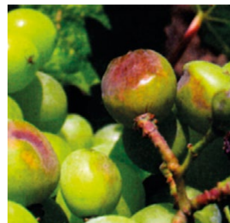
Obr. 14 Počátek slunečního úpalu

slunce dopoledne, je vhodné odlistit. Naopak odpolední sluneční záření má daleko větší intenzitu a doporučuje se odlistění zálistků.