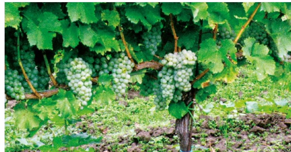
Obr. 13 Ideální odlistění u odrůdy Sauvignon

Je taky dobré odlistřovat každou stranu listové plochy zvlášť. Stranu, na kterou svítí