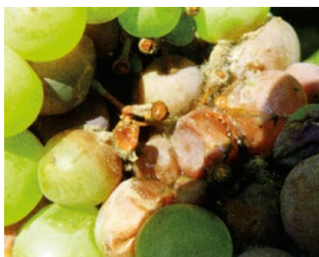
Obr. 11 Hniloba na stopěčkách bobulí uvnitř hroznů